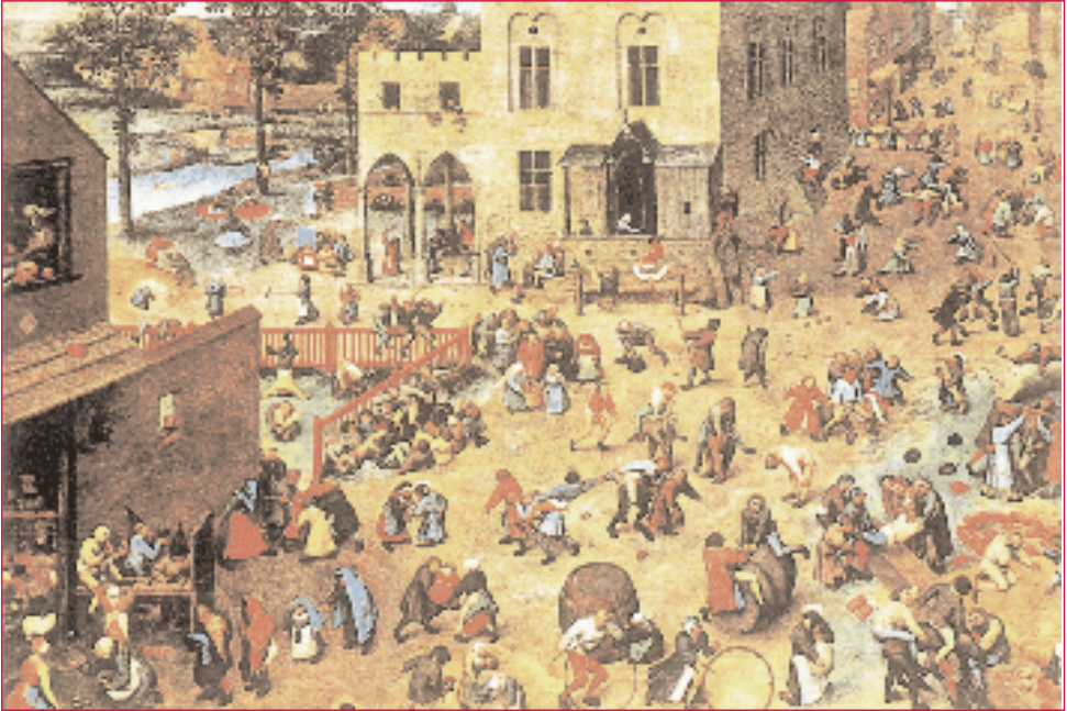
Xogos de nenos, por P. Brueghel.

[...] os nenos teñen necesidade duns espazos non especialmente deseñados para eles [...].